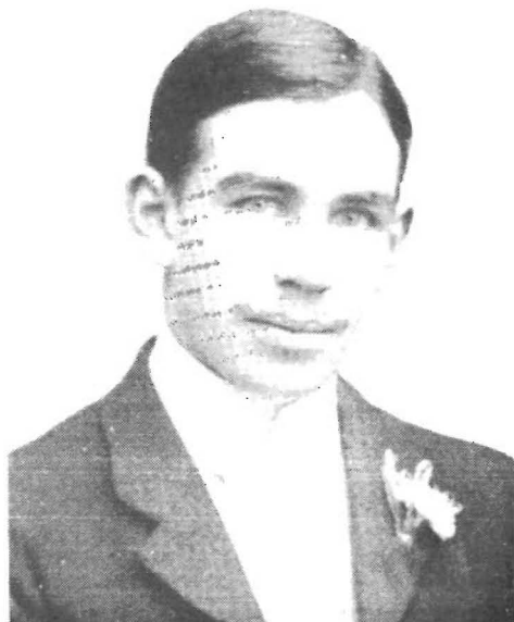
Robert Skidelsky, John Maynard Keynes, hopes betrayed 1883-1920 , Macmillan, London, 1983, 447 pp.

Dat verandert allemaal met het verstrijken van de Eerste Wereldoorlog en met het rampzalige verloop van de onderhandelingen tussen de alliantie en Duitsland over de naoorlogse economische orde. Skidelsky laat zien hoe de breuk met de gouden tijd van 1900-1914 op Keynes inwerkt. Hij ervaart deze catastrofes als de voorlopers van het einde van de beschaving, die van Eton, die van Cambridge, die van Bloomsbury. Hij schrijft het pessimisme van zich af in The economic consequences of peace (1919) en wordt in een klap met deze door hemzelf uitgegeven brochure steenrijk en wereldberoemd. Dan is het moment aangebroken om de ernstige economische wetenschap in de plaats te brengen van het onschuldige privé plezier. Dan ook haalt hij zijn concepten van stal. Een nieuwe theorie voor de korte termijn en een nieuw recept voor welwillende staatslieden.