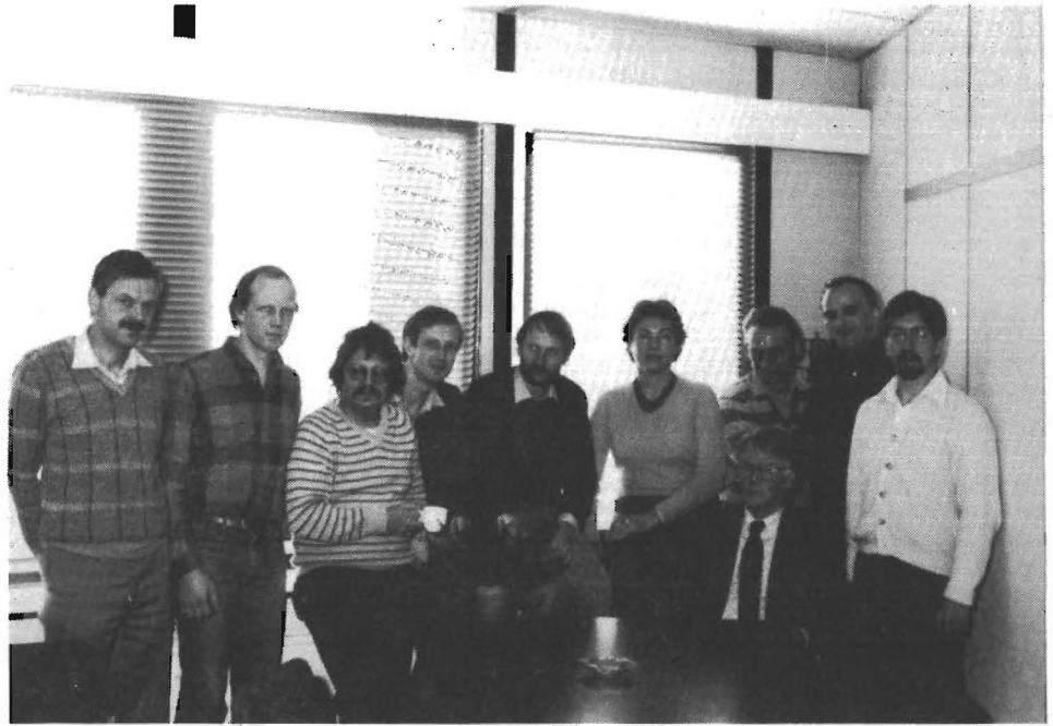
een gedeelte van de vakgroep poseert

bezwaarlijk, misschien wel wenselijk. Ten eerste kan een ieder zich meer bezighouden met datgene waarvoor hij het meest geschikt is. Als tweede argument kan worden aangevoerd, dat het in het onderwijs naar voren brengen van verricht onderzoek in de praktijk bij Wiskunde en Statistiek slecht uitvoerbaar is, vanwege haar hoge moeilijkheidsgraad. Tenslotte is het vaak zo dat medewerkers bij hun drang naar een hogere onderzoeksoutput de neiging kunnen hebben het onderwijs te laten schieten, zodat dit beter overgelaten kan worden aan specialisten. De bevruchting van onderzoek op onderwijs kan dan intern geschieden, zodat de eenheid van onderzoek en onderwijs op vakgroepsniveau gehandhaafd blijft.