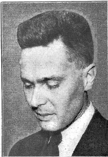
Prof. J. Tinbergen

Prof. J. Tinbergen werd geboren op 12-4-1903 te Den Haag. Hij studeerde wis- en natuurkunde te Leiden en promoveerde in 1929 op een proefschrift „Minimum problemen in de natuurkunde en de economie“.