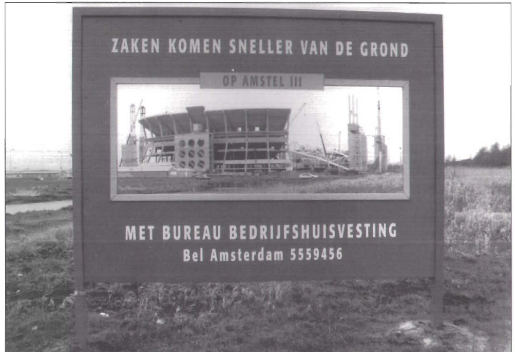
Het nieuwe stadion in Zuid-Oost in aanbouw

komt er langs, en vanaf 1996 ook de sneltram naar Sloterdijk. Ook het eindpunt van de zuidtangent, een buslijn van Haarlem via Schiphol naar Zuidoost, ligt bij het nieuwe Ajax-bastion. Van het stadion zal een boulevard leiden naar het winkelcentrum De Amsterdamse Poort. Deze promenade voert langs het NS-station Bijlmer, dat volgend jaar in verband met een spoorverdubbeling gesloopt en meteen herbouwd zal worden. Die verdubbeling is nodig voor de construc-