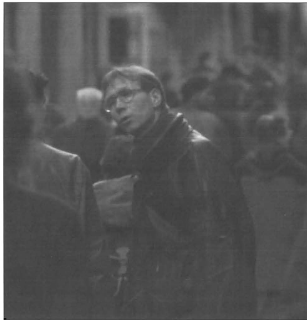
Scientology komt naar je toe deze zomer

dige uitkering naar Scientology over te maken en kan vervolgens beginnen met de 'Purification Rundown', een zuiveringsprogramma waarbij door veelvuldig saunagebruik en het slikken van vitaminepreparaten het lichaam van vervuiling wordt ontdaan.