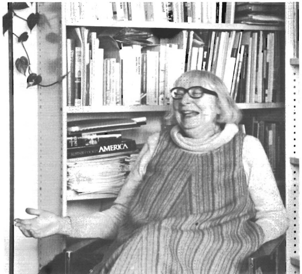
Jane Jacobs: 'Ze keken gewoon fout'

ik denk dat de grote fout van de macro- economen is dat ze proberen de economie te begrijpen in termen van naties. Niet in ter- men van steden. Maar wanneer ze wel in ste- den proberen te denken dan komt er een to- taal andere theorie!'