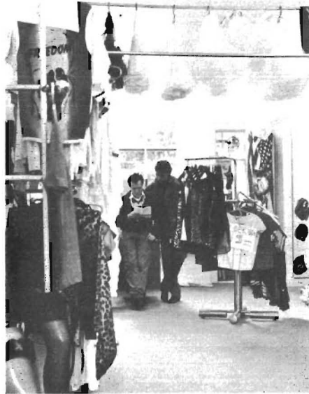
C'est tout à fait Titafet