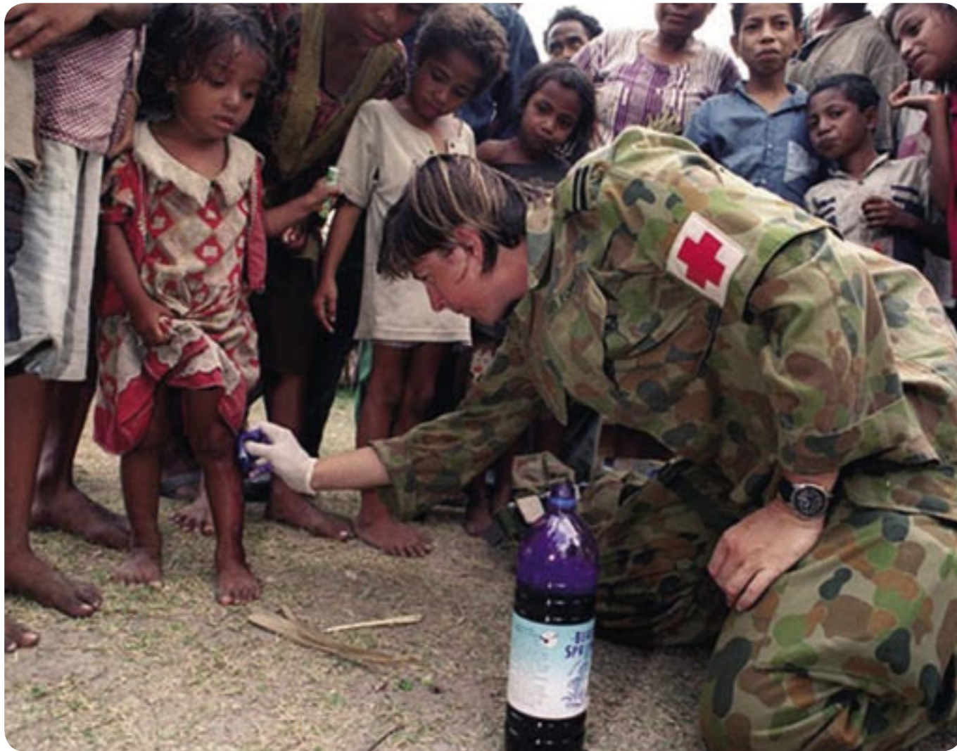
Een Australische militair op Oost-timor. Naast hun taak als stabilisatiemacht leveren de militairen ook humanitaire hulp.