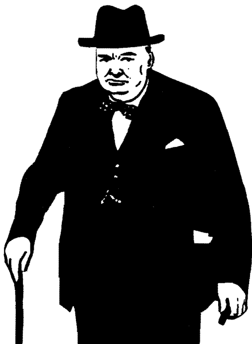
Sir Winston Churchill (1874-1965)

Daarnaast heeft Churchill steeds de gerechtigheid voor ogen gehouden. Toen op een keer Stalin voorstelde aan het einde van de oorlog de vijftig-