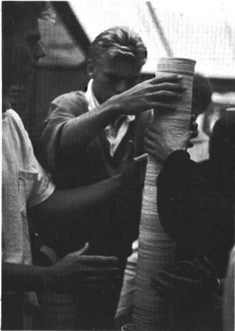
Aspirant economen bouwen aan hun toekomst