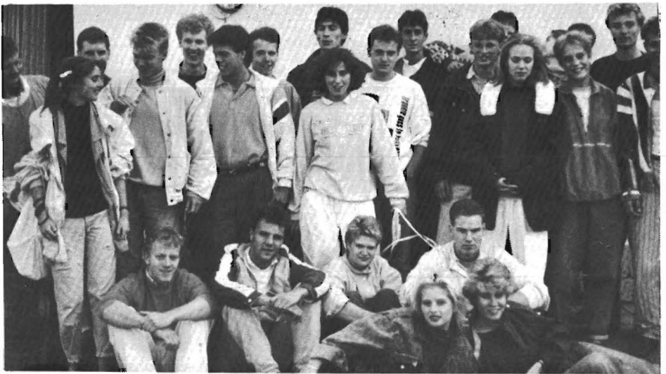
Een willekeurige eerstejaars werkgroep: 50% valt af