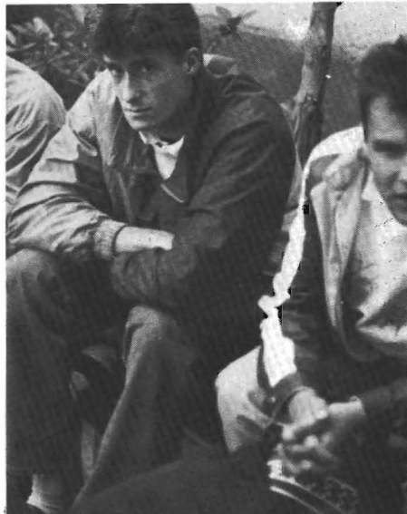
Sommigen zien het eerste jaar met angstbeven tegemoet...

De entree op de boerderij wordt enigszins bemoeilijkt door gigantische tentharingen en scheerlijnen. We brainstormen, vlie-