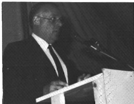
De jaarlijkse provocatie in de persoon van van der Zijp

Later ontstaat de, veelal tevergeefse, run op 'aandelen Hoeven'. De werkgroepindeling en borrel ('bier één gulden!') doen de laatste eenlingen verdwijnen.