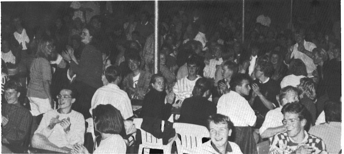
Volle bak, voor het eerst moest er geloot worden