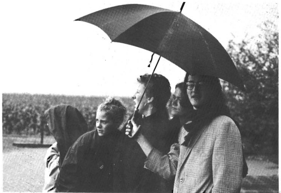
Ondanks het vele regenen...