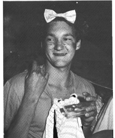
...anderen zijn wat zekerder van hun zaak

gen, tekenen, schrijven en stapelen ons naar de relatief voortreffelijke eerste maaltijd.