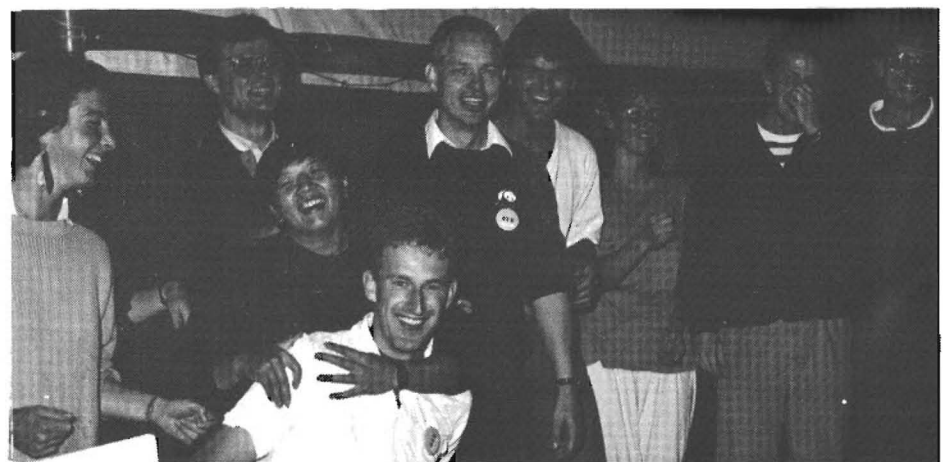
...ook dit jaar weer een prima job van de introductiecommissie